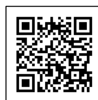
交換商品一覧 QRコード